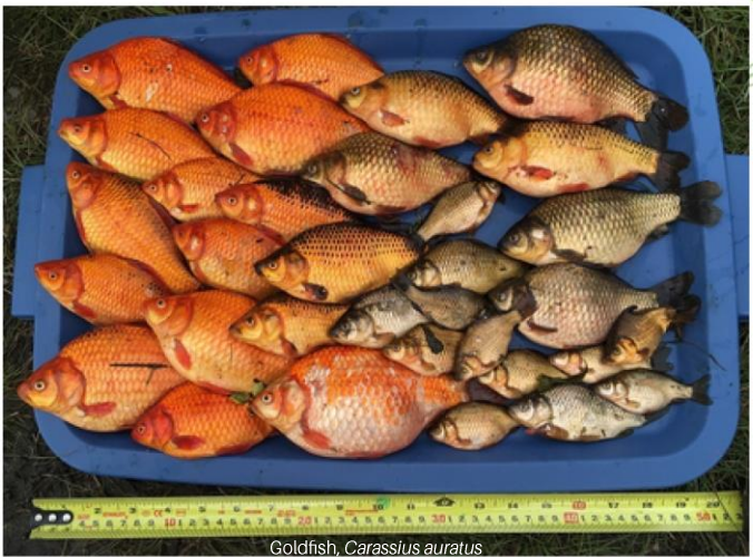
Goldfish, Carassius auratus